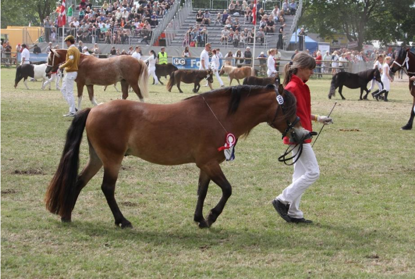
Ur Kul 646