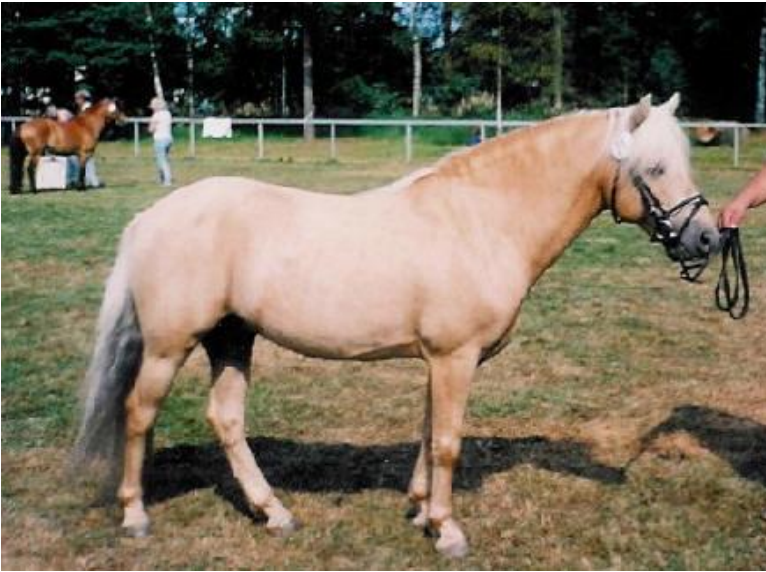
(Dugg GRH 9)

venstre hoftehjørne. Hesten skal støtte naturligt på alle fire ben. Hestens holdning af hoved og hals skal være naturlig.